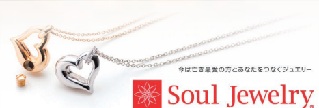
今はじき最愛の方とあなたをつなぐジュエリー