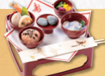
054 お食初め膳 1,296円(税込) 1,200円(税別)