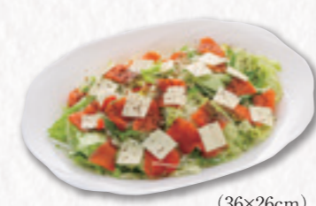
735 スモークサーモンサラダ (36×26cm) 3,240円(税込) 3,000円(税別)