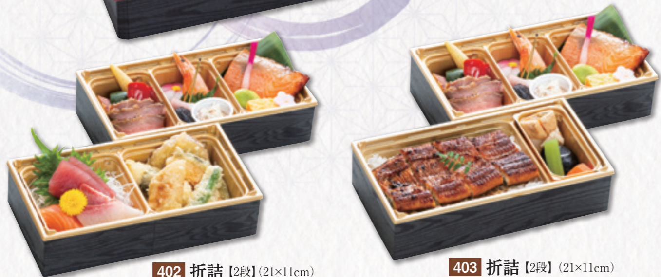
402 折詰【2段】 (21×11cm) 2,700円(税込) 2,500円(税別)