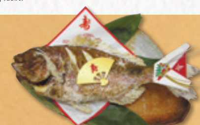
795 鯛姿焼き(約1kg〜) 6,480円(税込) 6,000円(税別)