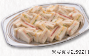
690 サンドイッチ (36×23cm) 2,592円(税込) 2,400円(税別)