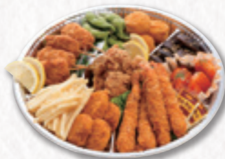
315 オードブル (32cm) 3,780円(税込) 3,500円(税別)