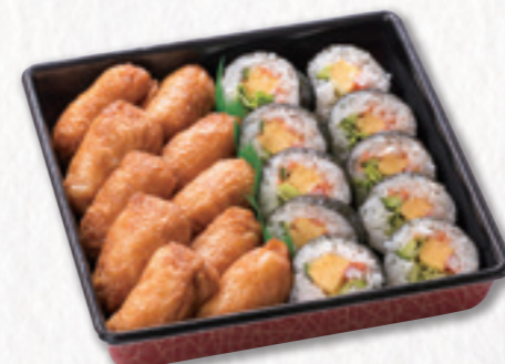
551 寿司重【サラダ巻き&いなり】 (23×23cm) 2,700円(税込) 2,500円(税別)