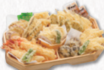
711 天ぷら皿 (36×24cm) 3,780円(税込) 3,500円(税別)