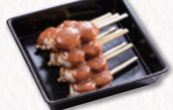
667 五平餅【10串】 (23×23cm) 1,620円(税込) 1,500円(税別)