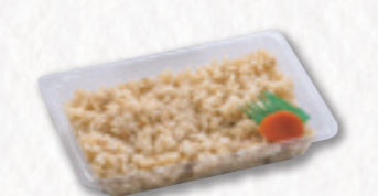
621 味ごはんパック【1人前】 486円(税込) 450円(税別)