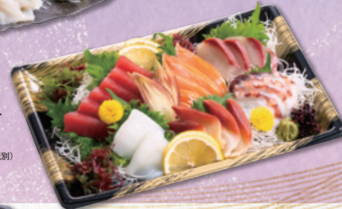
121 お刺身盛合わせ (28×19cm) 4,320円(税込) 4,000円(税別)