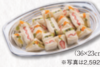
691 フルーツサンドイッチ (36×23cm) 2,592円(税込) 2,400円(税別)