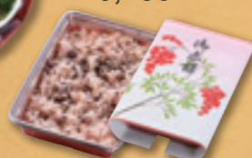
623 赤飯 540円(税込) 500円(税別)