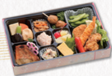
415 折詰 (27×18cm) 1,080円(税込) 1,000円(税別)