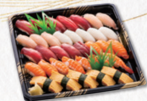
532 握り寿司【35貫】 (33×33cm) 5,940円(税込) 5,500円(税別)