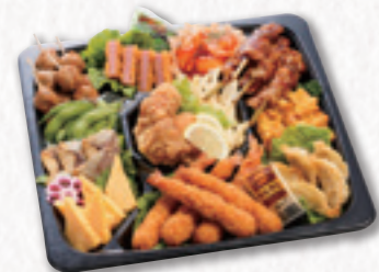
314 オードブル (33×33cm) 5,400円(税込) 5,000円(税別)