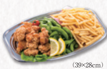
317 おつまみオードブル (39×28cm) 2,700円(税込) 2,500円(税別)