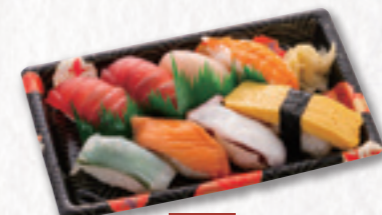
558 握り寿司【1人前】 1,296円(税込) 1,200円(税別)