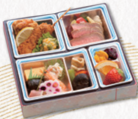
416 折詰 (24×24cm) 1,620円(税込) 1,500円(税別)