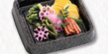
738 漬物重 (20×20cm) 1,620円(税込) 1,500円(税別)