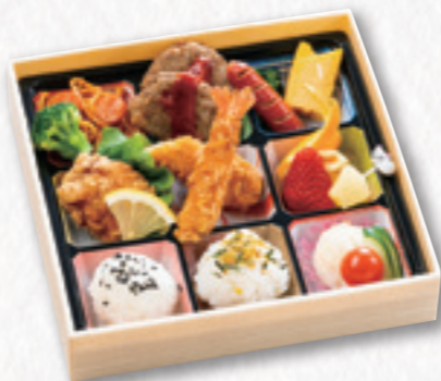
E-422 お子様折詰 (21×21cm) 1,296円(税込) 1,200円(税別)