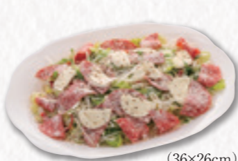
736 モッツアレラチーズサラダ (36×26cm) 3,240円(税込) 3,000円(税別)