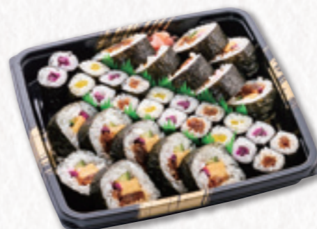
553 寿司皿 (29×29cm) 2,700円(税込) 2,500円(税別)