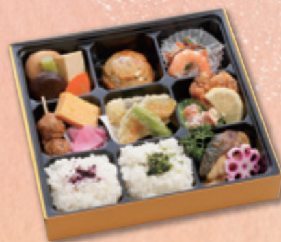
604 弁当 (24×24cm) 1,080円(税込) 1,000円(税別)