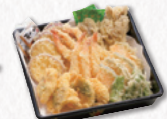
712 天ぷら皿 (23×23cm) 2,700円(税込) 2,500円(税別)