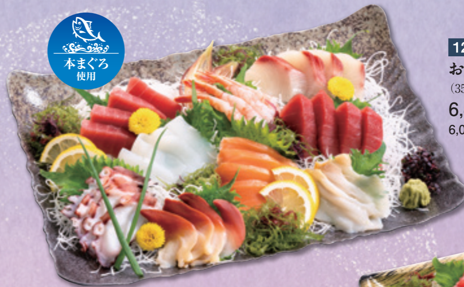
120 お刺身盛合わせ (35×25cm) 6,480円(税込) 6,000円(税別)