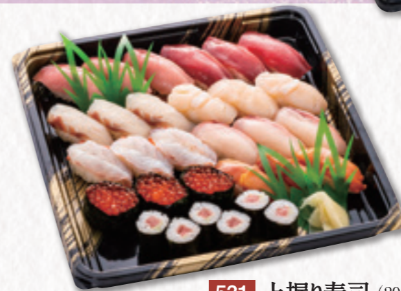
531 上握り寿司 (29×29cm) 7,020円(税込) 6,500円(税別)