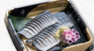
715 酢さば【一尾】 (24.5×24.5cm) 2,592円(税込) 2,400円(税別)