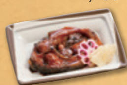
716 鯉旨煮 702円(税込) 650円(税別)