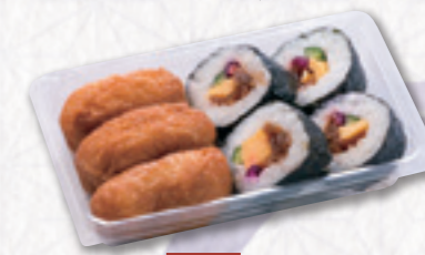
560 助六寿司【1人前】 648円(税込) 600円(税別)