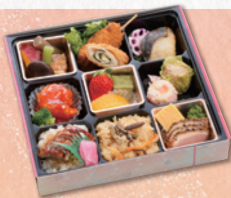
605 弁当 (24×24cm) 1,620円(税込) 1,500円(税別)

各種会合や、イベント等に 味わい豊かな食材で お弁当をお作りいたします。 ※お弁当のお米は長野県産を 使用しています。