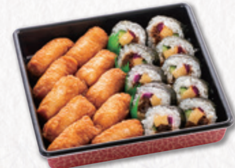
555 寿司重【いなり入】 (23×23cm) 2,700円(税込) 2,500円(税別)