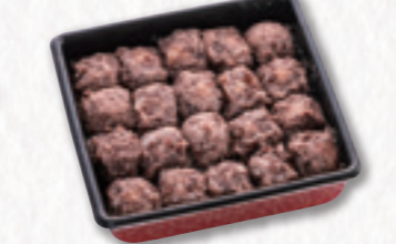
663 あんころ重【20個入】 (20×20cm) 2,160円(税込) 2,000円(税別)