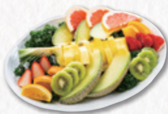
737 フルーツ盛 (38×27cm) 3,240円(税込) 3,000円(税別)