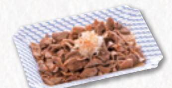
783 豚おたぐり (26×20cm) 1,620円(税込) 1,500円(税別)