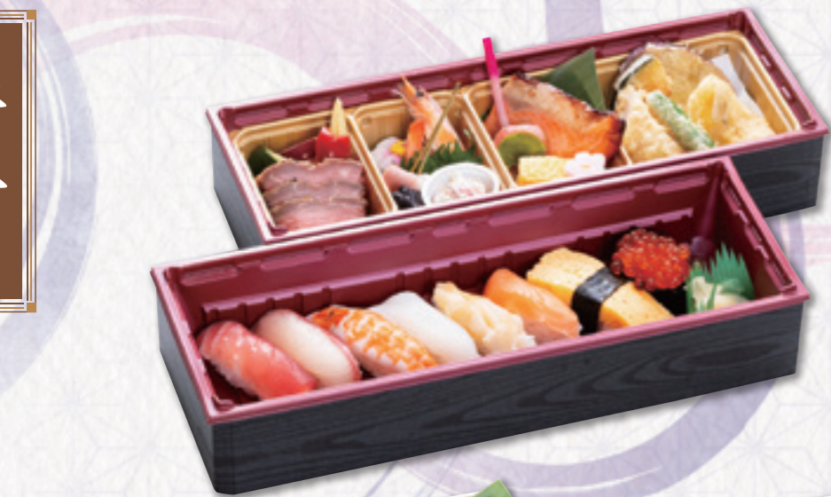
401 折詰【2段】 (32×12cm) 3,780円(税込) 3,500円(税別)