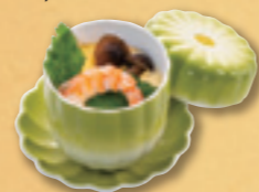
788 茶碗蒸し 324円(税込) 300円(税別)

※お持帰りお届けの場合、軽減税率が適用されます。※季節によりお料理の内容・容器が変わる場合がございます。※写真はイメージです。※お料理に卵・乳・小麦・そば・落花生・えび・かに・くるみを含んでいる場合がございますので、事前にご確認ください。