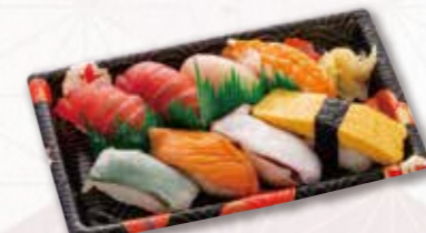
557 握り寿司【1人前】 1,080円(税込) 1,000円(税別)