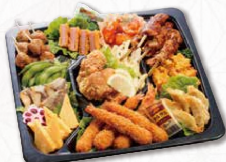
314 オードブル (33×33cm) 5,400円(税込) 5,000円(税別)