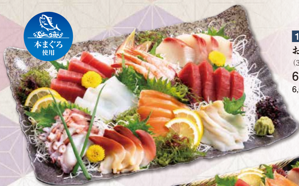
120 お刺身盛合わせ (35×25cm) 6,480円(税込) 6,000円(税別)