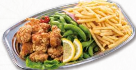
317 おつまみオードブル (39×28cm) 2,700円(税込) 2,500円(税別)