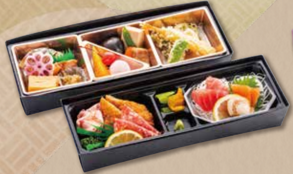
E-417 折詰【2段】 (34×13cm) 3,240円(税込) 3,000円(税別)