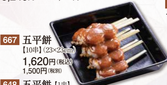
667 五平餅 【10串】(23×23cm) 1,620円(税込) 1,500円(税別)