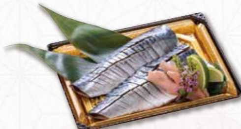
715 酢さば【一尾】(25×18cm) 2,592円(税込) 2,400円(税別)