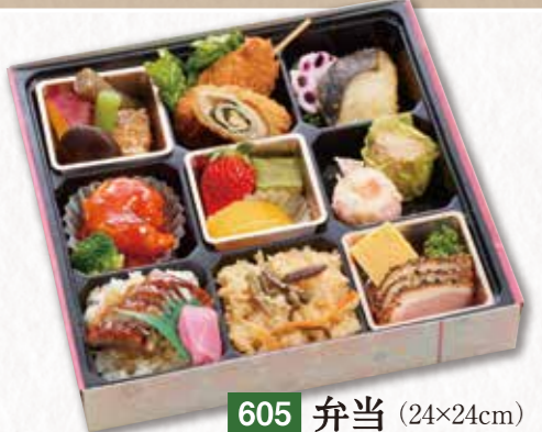
605 弁当 (24×24cm) 1,620円(税込) 1,500円(税別)