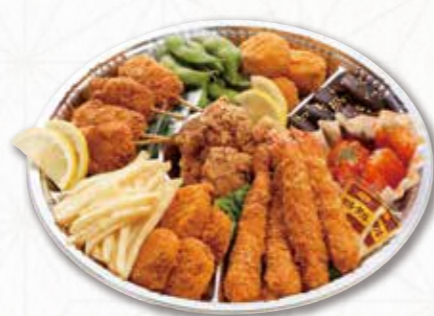
315 オードブル (32cm) 3,780円(税込) 3,500円(税別)