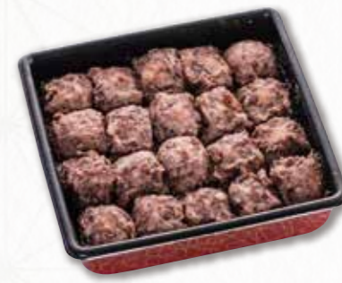
663 あんころ重【20個入】 (20×20cm) 2,160円(税込) 2,000円(税別)