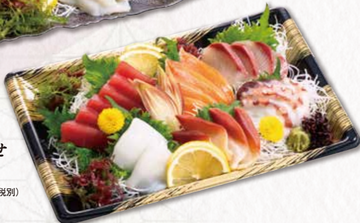
121 お刺身盛合わせ (28×19cm) 4,320円(税込) 4,000円(税別)