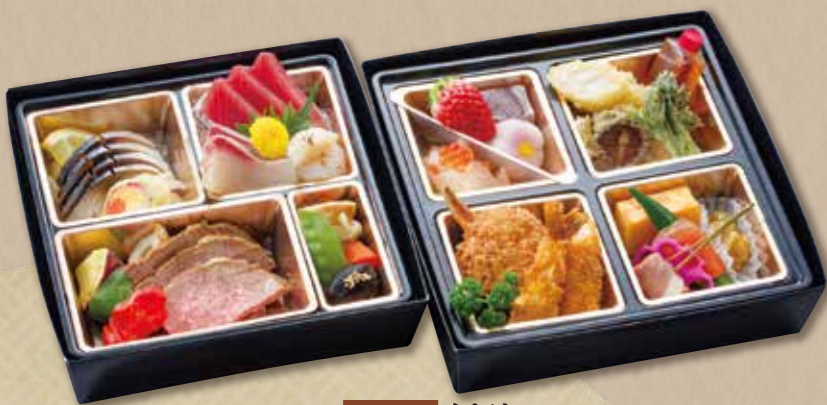
E-419 折詰【2段】 (23×23cm) 4,860円(税込) 4,500円(税別)

旬の厳選素材を選び、洗練されたお料理の数々でお席を彩ります。 ◆ご希望により、内容の変更等も承ります。