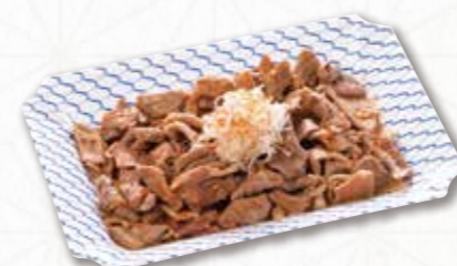
783 豚おたぐり (26×20cm) 1,620円(税込) 1,500円(税別)