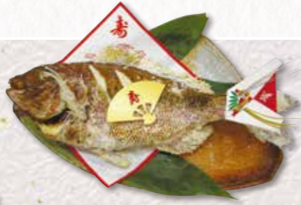
795 鯛姿焼き (約1kg~) 6,480円(税込) 6,000円(税別)