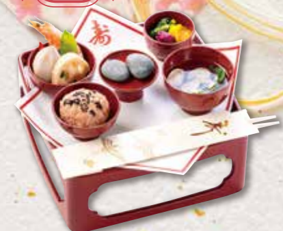
054 お食初め膳 1,296円(税込) 1,200円(税別)