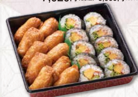
551 寿司重【サラダ巻き&いなり】(23×23cm) 2,700円(税込) 2,500円(税別)