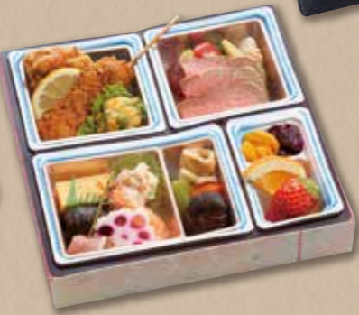
416 折詰 (24×24cm) 1,620円(税込) 1,500円(税別)