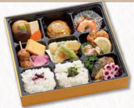
604 弁当 (24×24cm) 1,080円(税込) 1,000円(税別)

◆ご希望により、内容の変更等も承ります。 ※お弁当のお米は長野県産を使用しています。