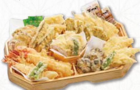
711 天ぷら皿 (36×24cm) 3,780円(税込) 3,500円(税別)