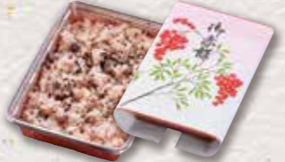
623 赤飯 540円(税込) 500円(税別)