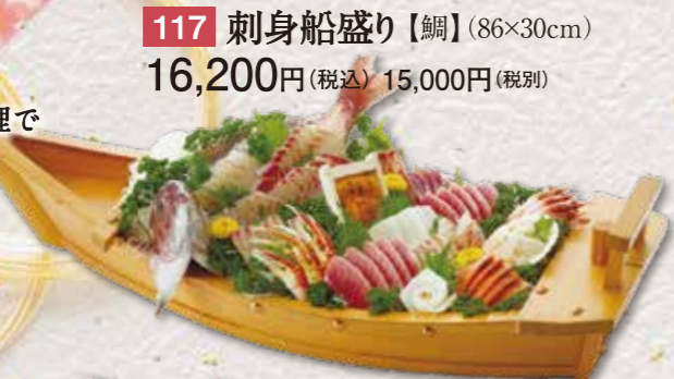
117 刺身船盛り【鯛】 (86×30cm) 16,200円(税込) 15,000円(税別)