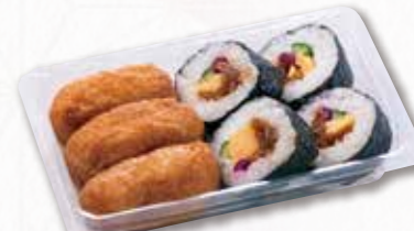
560 助六寿司【1人前】 648円(税込) 600円(税別)

648 五平餅【1串】 162円(税込) 150円(税別) ※別途容器代が必要な場合があります。