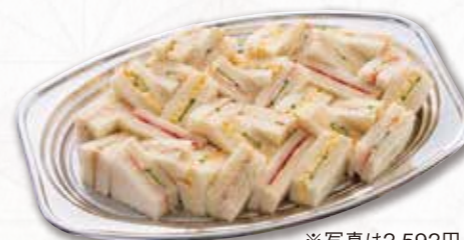
690 サンドイッチ (36×23cm) 2,592円(税込) 2,400円(税別)