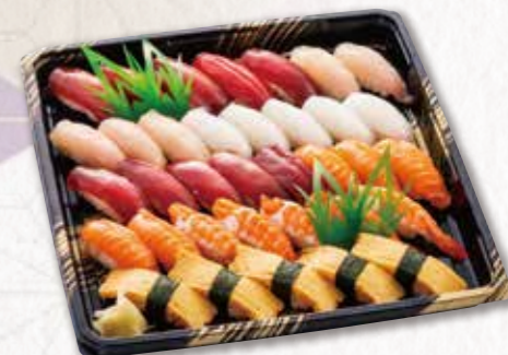
532 握り寿司【35貫】(33×33cm) 5,940円(税込) 5,500円(税別)