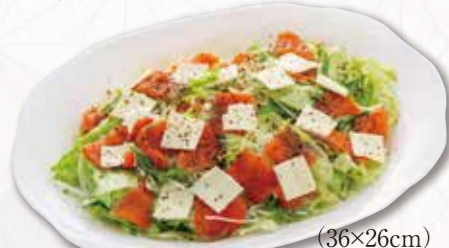
735 スモークサーモンサラダ (36×26cm) 3,240円(税込) 3,000円(税別)