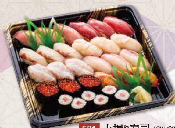
531 上握り寿司 (29×29cm) 7,020円(税込) 6,500円(税別)

こだわりのネタを握り集いの席を華やかに演出します。 ※醤油小袋は付属していません。 ※お寿司のお米は国産米を使用しています。