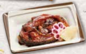
716 鯉旨煮 702円(税込) 650円(税別)