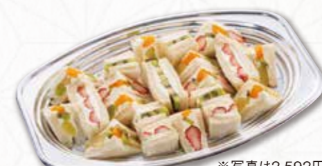
691 フルーツサンドイッチ (36×23cm) 2,592円(税込) 2,400円(税別)