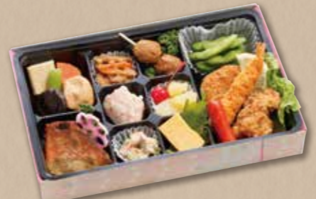
415 折詰 (27×18cm) 1,080円(税込) 1,000円(税別)