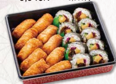
555 寿司重【いなり入】(23×23cm) 2,700円(税込) 2,500円(税別)