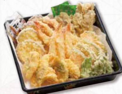
712 天ぷら皿 (23×23cm) 2,700円(税込) 2,500円(税別)