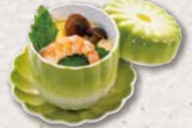
788 茶碗蒸し 324円(税込) 300円(税別)