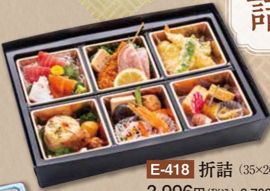
E-418 折詰 (35×26cm) 3,996円(税込) 3,700円(税別)