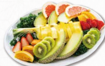
737 フルーツ盛 (38×27cm) 3,240円(税込) 3,000円(税別)