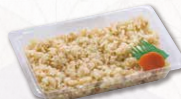
621 味ごはんパック【1人前】 486円(税込) 450円(税別)