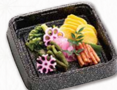
738 漬物重 (20×20cm) 1,620円(税込) 1,500円(税別)