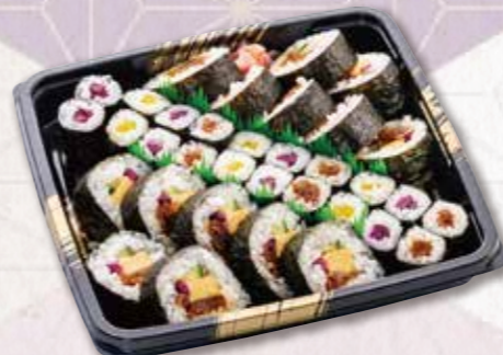
553 寿司皿 (29×29cm) 2,700円(税込) 2,500円(税別)