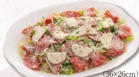
736 モッツアレラチーズサラダ (36×26cm) 3,240円(税込) 3,000円(税別)